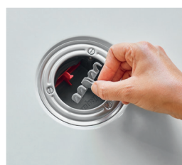
Filtro para cabello extraíble

Limpieza fácil por arriba gracias a su filtro extraíble para cabello. Fácil mantenimiento, rápido y sin desifonaje. Cartucho con membrana extraíble: mantenimiento completo y acceso a la tubería.