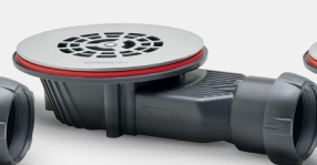
Rejilla plana de acero inoxidable cepillado