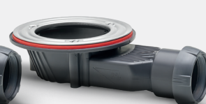
Sin rejilla para plato de ducha extraplano