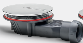
Champiñón ABS cromado